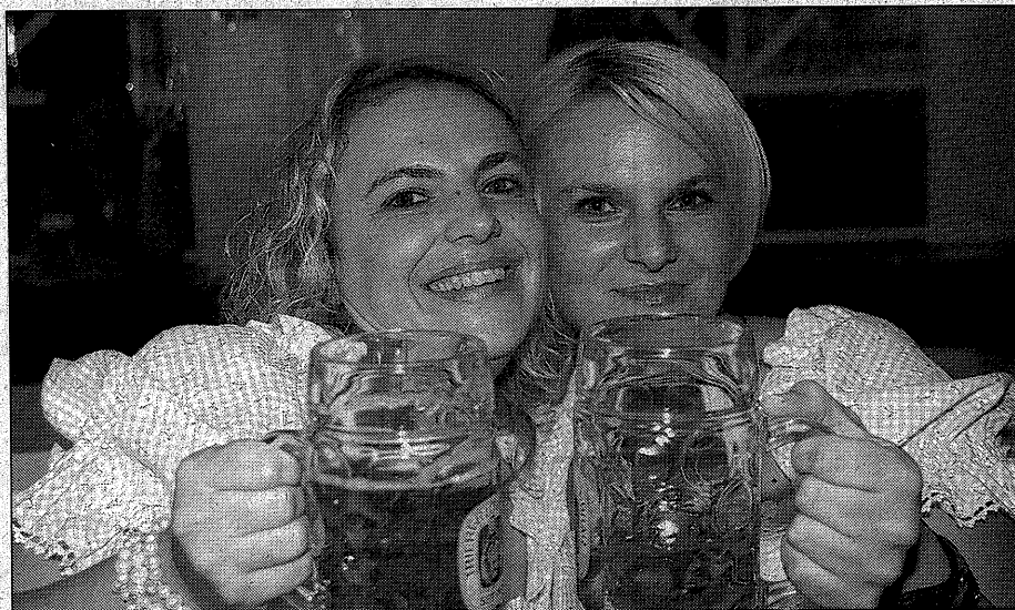
So ist die Stimmung in Rabenau, wenn zünftig gefeiert wird. Drei tolle Tage schon im September stehen jetzt an.

RABENAU. In der Stuhlbauerstadt hat sich ein reges Vereinsleben entwickelt. Auf den Karnevalsverein, sprich den Elferrat, ist da auch immer Verlass. Seit nunmehr 16 Jahren ist im „Spätsommer“ das Oktoberfest die Nummer ein. Es findet vom 25. bis 27. September statt. Anfang der 1950er Jahre wurde Rabenau zu einer festen Größe in der Reihe der sächsischen Faschingshochburgen. Anfangs waren es nur Vereinsvergügen des Chores der Stuhlbauerstadt Rabenau. Daraus gründete sich 1957 der erste Elferrat. Am 13. April 1991 beschloss der Elferrat Rabenau auf der Mitgliederversammlung die Gründung des Vereins, der fortan als Elferrat Rabenau e.V. Sachsen besteht. Heute verfügt der ERR über 60 Mitglieder, zum Teil sehr attraktive. Und er hat sich einem Motto verschrieben: Der Verein, der das ganze Jahr für Stimmung sorgt! (isi)